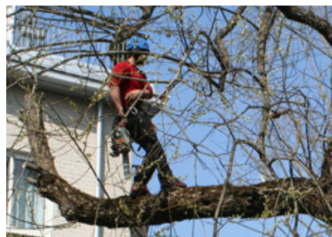
Träden kommer att beskäras av professionella arborister.

Det förvaras alltför många cyklar i gången mellan port 18-20. Har du plats i en cykelbur i källaren är vi tacksam om du i första hand ställer cykeln där.